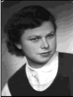
1953 - maturantka

ly?“ rozhodla som sa povyzvedať spomienky mojej mamy na svoju rodnú dedinu a zapísať ich. Veľmi mi je ľúto, že som nezapísala aj otcove spomienky. Ak vám rodičia ešte žijú, nečakajte prídlho. Sú to vzácne veci, ktoré sa môžu nenávratne stratiť. Mnohé spomienky stoja za to, aby sme sa s nimi podelili aj s ostatnými.