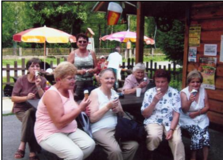
počas prestávky v Liptovskom Jáne

Obhliadka hradieb mesta Levoča a návšteva rozlohou najväčšieho hradu v Strednej Európe – Spišského hradu – boli ďalšie zastávky. Prekvapil nás veľký záujem návštevníkov o túto významnú stavebnú pamiatku.