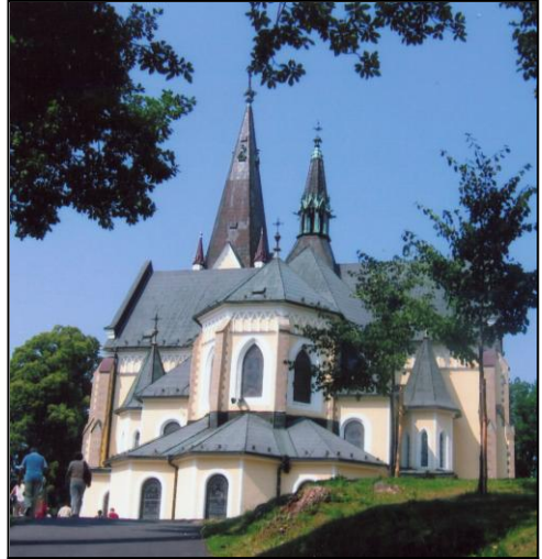
kostol v Levoči na Mariánskej hore

Športový areál na Donovaloch bol poslednou zastávkou. Cestu domov, v dobrej nálade, sme spestrili ľudovými i mariánskymi piesňami.