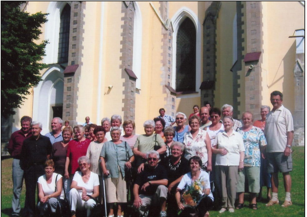
účastníci zájazdu v Levoči pred kostolom na Mariánskej hore

Ubytovali sme sa vo Svite, kde nás po úmorných horúčavách privítala výdatná dažďová nádielka. Ráno sme sa